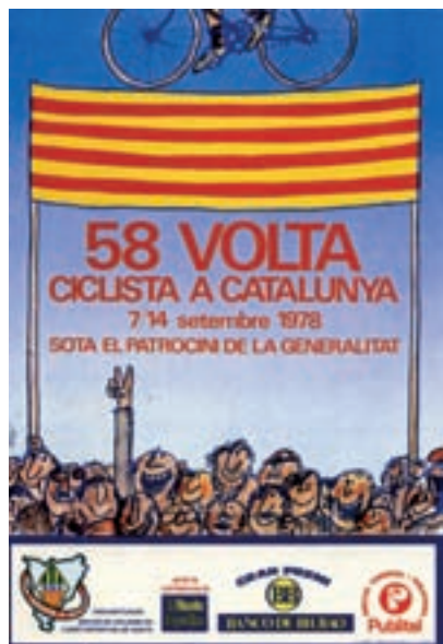
Figura 13 Cartel de la 58. a Volta, 1978. Autor: Cesc.