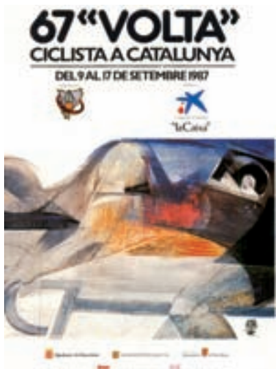
Figura 20 Cartel de la 67. a Volta, 1987.