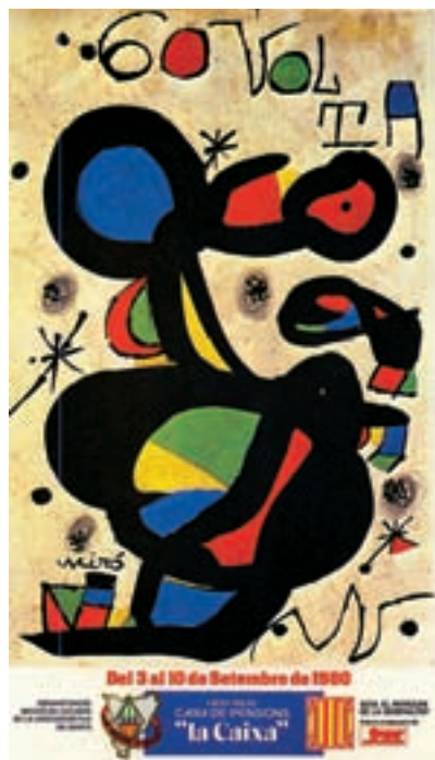
Figura 14 Cartel de la 60. a Volta, 1980. Autor: J. Miró.