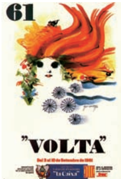
Figura 15 Cartel de la 61. a Volta, 1981. Autor: M. Cuixart.