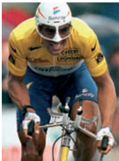
Figura 19 Miguel Indurain.