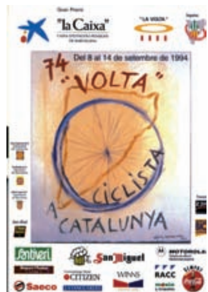
Figura 22 Cartel de la 74. a Volta, 1994. Autor: Ràfols Casamada.

Popovych (ganador, 85. a ) y Vladimir Karpets (ganador, 87. a ). En 2005 la Volta adquirió la categoría de figurar en la “Uci Pro Tour” (competición impulsada por la Unión Ciclista Internacional, en