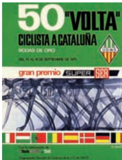
Figura 12 Cartel de la 50. a Volta, 1970. Autor: Mauri.