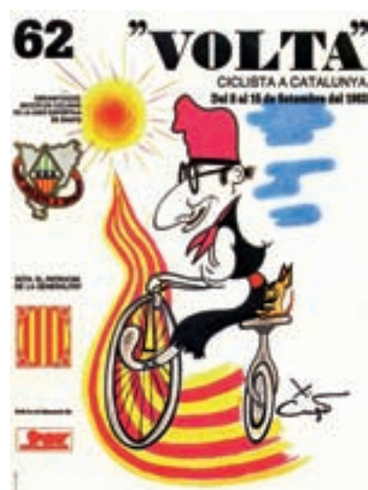
Figura 16 Cartel de la 62. a Volta, 1982. Autor: X. Cugat.