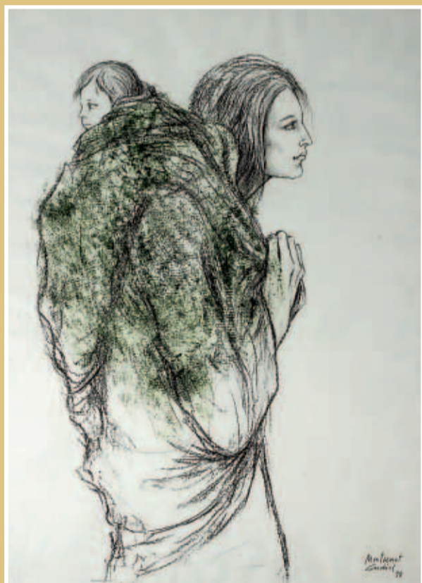
"Mare i Fill", de Montserrat Gudiol (1998)