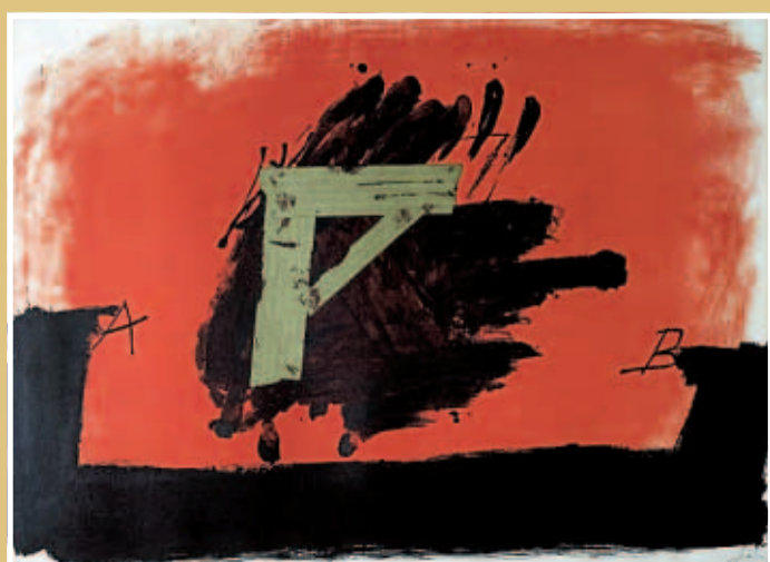
El fondo de arte cuenta con un Tàpies de 1990